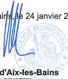
Le Maire d'Aix-les-Bains Renaud BERETTI